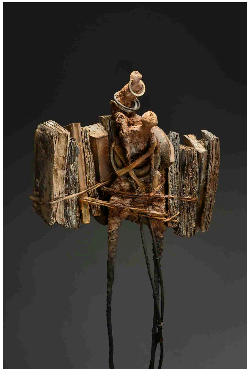
Marc Perez Hôtel de Ville