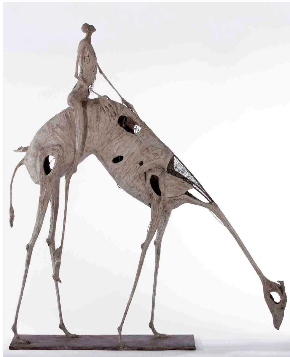
Pascale Marchesini-Arnal Parc Monod